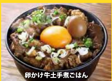
卵かけ牛土手煮ご飯