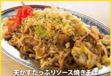
天かすたっぷりソース焼きそば