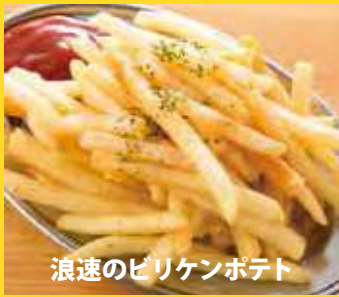
浪速のピリケンポテト